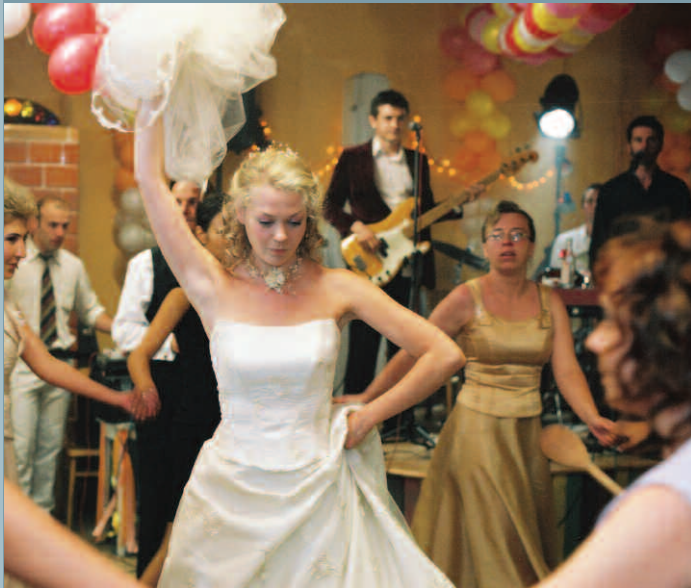
Left: Wesele The Wedding Below: Rekopis Znaleziony w Saragossie The Saragossa Manuscript